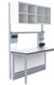
2. S.S. Estante y armario mural