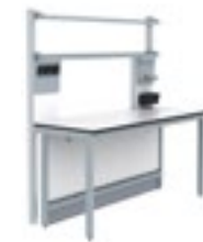
1. S.S. Dos estantes murales