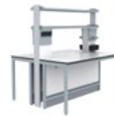
4. S.S. Dos estantes centrales