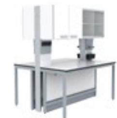
6. S.S. Armario centrales