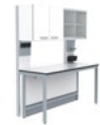
3. S.S. Armarios murales