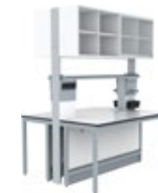
5. S.S. Estante y armario central